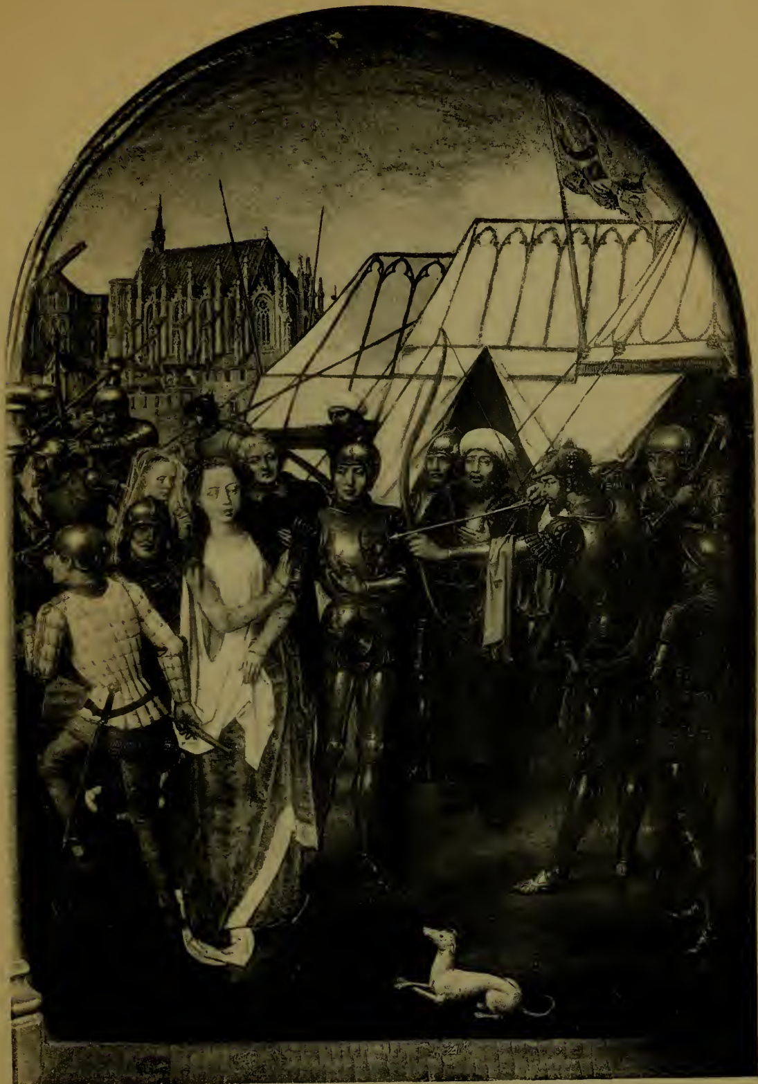
La Mort de Sainte-Ursule Sixième panneau de la Châsse de Ste-Ursule.